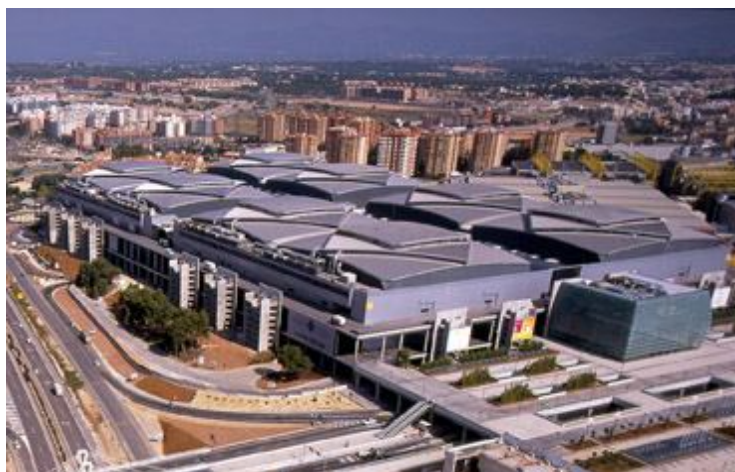
Vista aérea de la Feria de Valencia

Infinidad de servicios tanto para los expositores de la feria, como para los visitantes de la misma.